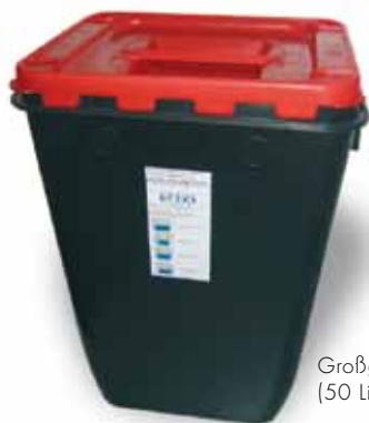
Großbinde (50 Liter)