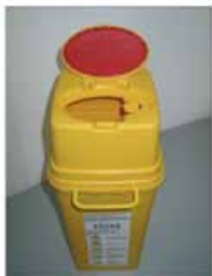
6-Liter-Behälter - geöffnet mit Nadelentferner