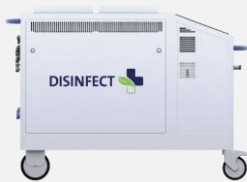
Weltweit patentierter Ultraschallverdampfer