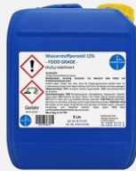
Weltweit anerkanntes Desinfektionsmittel (=Wasserstoffperoxid + Silberionen)